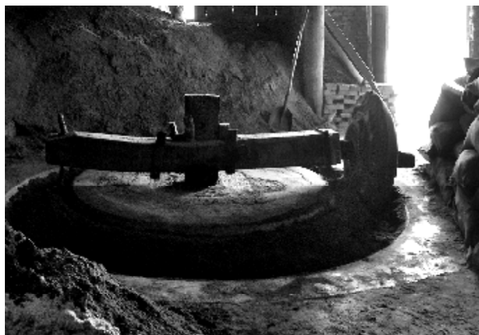
水碾房曾经是大同场镇惯见的风景。

碾好一槽米需要两三个小时，因为闸满一沟水，只能碾一挑100斤左右的稻谷，同时向碾房主人支付两三角钱的加工费。有时加工完谷物，没有带钱的就挂账。碾房主人拿出记账本写上加工谷物的斤两，再让对方签名，等下次来碾米磨面时再付钱，也有的半年或者一年结账的。每当送来的谷物多，白天碾不完，晚上就得加班。在物资匮乏的年代，小孩子没事总爱跟在大人的箩筐后，屁颠屁颠往碾房跑，凑热闹。磨盘不紧不慢转动着，碾子一圈一圈滚动，碾磨过程中，还需拿一把扫帚不停地把碾到边上的谷物扫到碾槽中。碾到一定程度，就将它们铲出槽，倒进风簸机，摇动风轮，随着风簸机咕噜咕噜飞转，白米和糠面从不同槽口出来，成功分开。米通过漏斗进入箩筐里，糠则随风扬出风簸机外——而那新米的清香也随之弥漫了整个碾房。有时候，因为太晚，等不到大人把米碾好簸好，小孩子就困