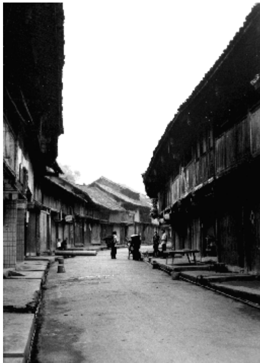
大同宽阔通透的茶马古街，两边连排的建筑多为木质吊脚楼，虽然较旧，但风韵犹存。

担水挑过，浑身精神就足了，正好干活。傍晚挑水也不错，刚收工回来就要煮晚饭，趁暮色未浓，抓紧时间把空空的水缸挑满。每天清晨，水井坎上总会排起长长的挑水“大军”，木桶打水的撞击声十分清脆，把人们从睡梦中唤醒。早起挑水煮早饭、烧开水的人络绎不绝，人排人，桶跟桶，十分热闹。各式各样的水桶在水井坎排成一行，轮到谁就上去打水。水井坎深达三丈，井沿边常年摆放着一根提水用的一丈多长的斑竹竿和一只公用水桶。竹竿头的那端