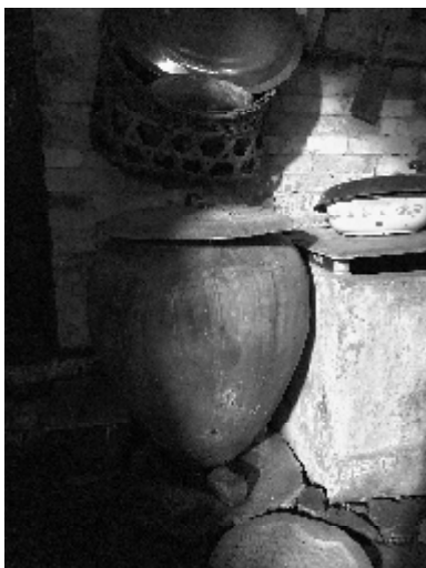
搁在厨房里的圆形敞口水缸。

无论春夏秋冬还是刮风下雨，街坊百姓每天早晚煮饭前的第一件事就是操起扁担水桶，到场口南边的水井坎去担水。