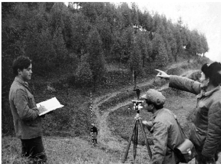
县林业局的技术人员会同火井林场的林业员，经常测量、观察新栽树木的生长情况。